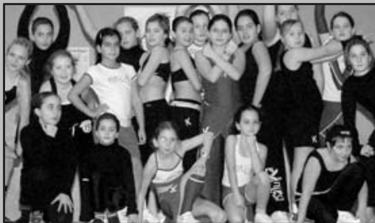
■ GALA SOLIDARIA A CARGO DE LA ACADEMIA NIBEL. IMAGEN GALA ENERO 2007

tes, la organización se reserva el derecho de suspender el mismo. Cada concursante interpretará dos jotas de libre elección, cuyos títulos harán llegar a la organización y no podrán sustituirse por otros, junto con los datos de la inscripción. El jurado valorará en cada intérprete la voz, afinación, ritmo, compás y estilo y todos los concursantes dispondrán de la misma rondalla. Se establecen dos categorías: Infantiles, hasta los catorce años de edad en solistas y dúos y Mayores a partir de los quince años, también en solistas y dúos. Los Premios serán: Infantiles, 1º Premio de 240 euros y trofeo, 2º Premio de 180 euros y trofeo y 3º Premio de 120 euros y trofeo en ambas modalidades; Mayores, 1º Premio de 420 euros y trofeo, 2º Premio de 275 euros y trofeo y 3º Premio de 210 euros en ambas modalidades. Habrá un Premio a la Mejor Jota dedicada al Casco Antiguo donado por la Tacita de Juan y un Premio a la