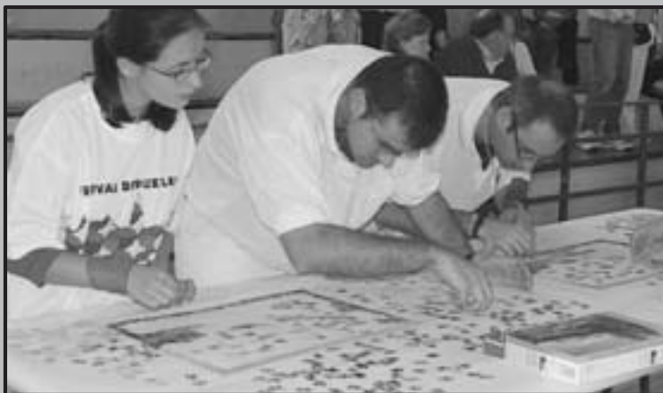
PRESENTADAS LAS BASES DEL XI FESTIVAL DE PUZZLES POR PAREJAS

La Dirección General de Medio Natural del Gobierno de La Rioja ha adjudicado a la empresa Ecop S.A. la ejecución de un proyecto de mejoras piscícolas en el coto intensivo de Arnedo, en el río Cidacos, por un importe de 28.854 euros. Los trabajos mejorarán el hábitat de la trucha, al tiempo que posibilitarán la habitabilidad del tramo para otras especies presentes, como el barbo de montaña, loina, lamprehuela o foxino. Las intervenciones está previsto que comiencen a principios de Septiembre y se efectuarán en un tramo de unos 3,5 kilómetros del río Cidacos a su paso por Arnedo, desde el límite del término municipal de Herce hasta el puente de la carretera LR-123 que une esta localidad con Cervera del Río Alhama. Esta actuación se pone en marcha a petición de la Asociación de Pescadores del Cidacos, y