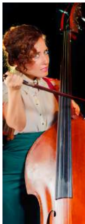
2 de FEBRERO 22.30 h. 3 de FEBRERO 22.30 h. Sala Florida. FUNAMVIOLISTAS