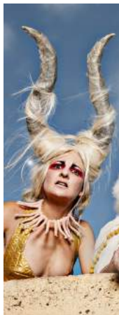
16 de FEBRERO 22.30 h. 17 de FEBRERO 22.30 h. Sala Florida. LAS NIÑAS DE CÁDIZ