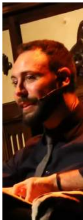
9 de FEBRERO 22.30 h. 10 de FEBRERO 22.30 h. Sala Florida. 50 SOMBRAS DE ANDREU