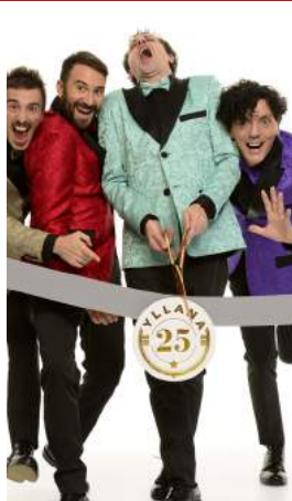
2 de MARZO 22.30 h. 3 de MARZO 22.30 h. Sala Florida. YLLANA